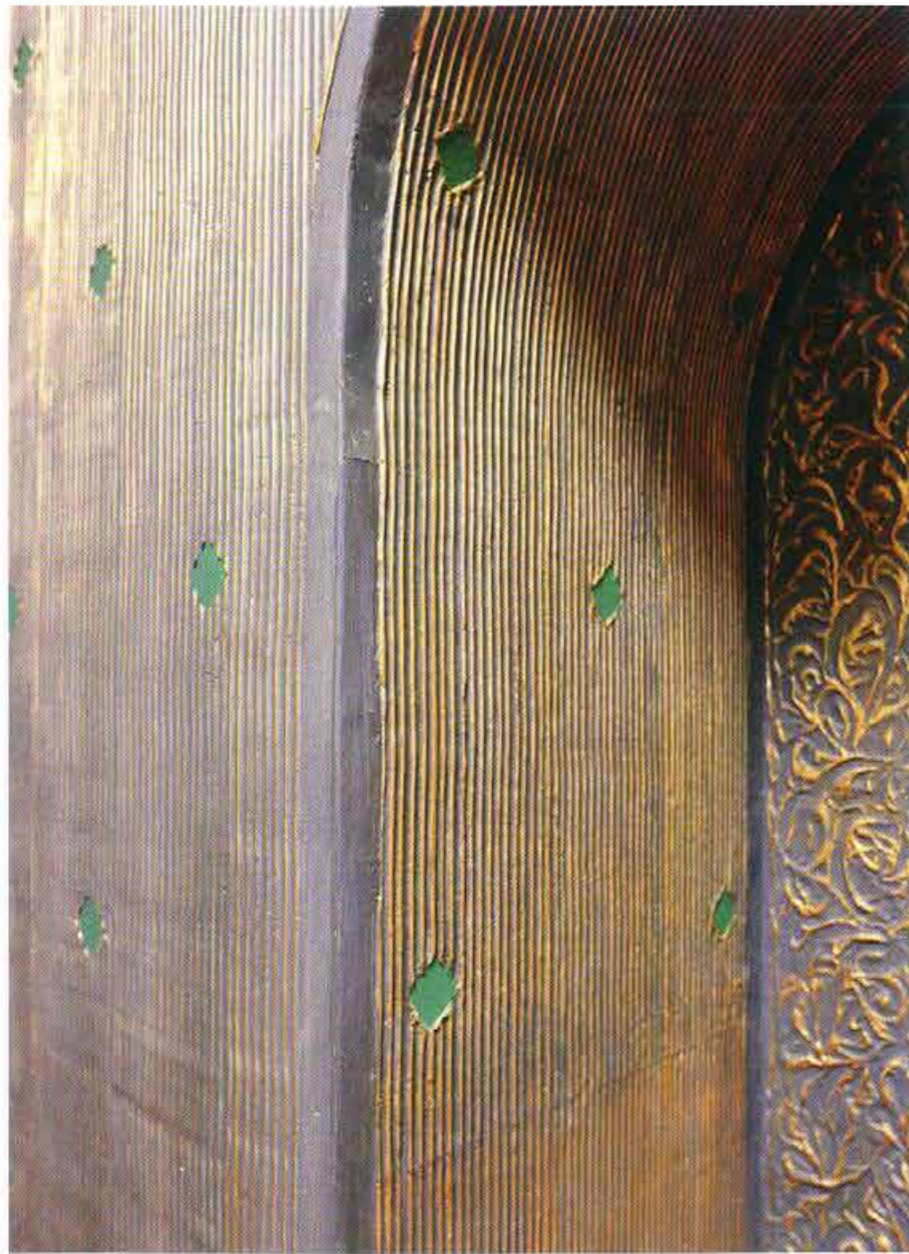
Detail - Wohnhaus in Laage